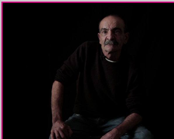
Fotograma de Terra de Ninguém , Salomé Lamas, 2012

Inscripción gratuita en: http://projecció.uv.es